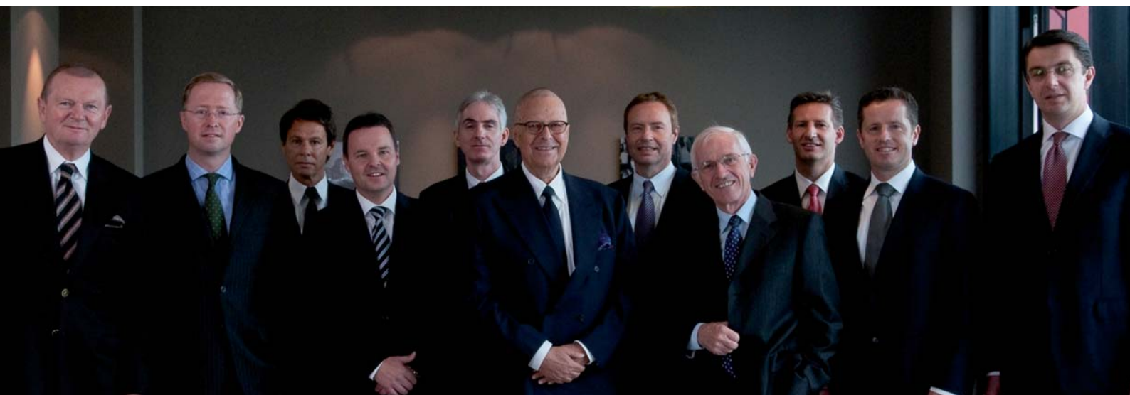
Verwaltungsrat und Geschäftsleitung

Damit wir die Chancen in einer sich ständig verändernden Welt nutzen können, legen wir grosses Gewicht auf Innovationen. Dies bedeutet, dass wir permanent nach neuen Wegen der Wertschöpfung in unseren Portfoliofirmen suchen.